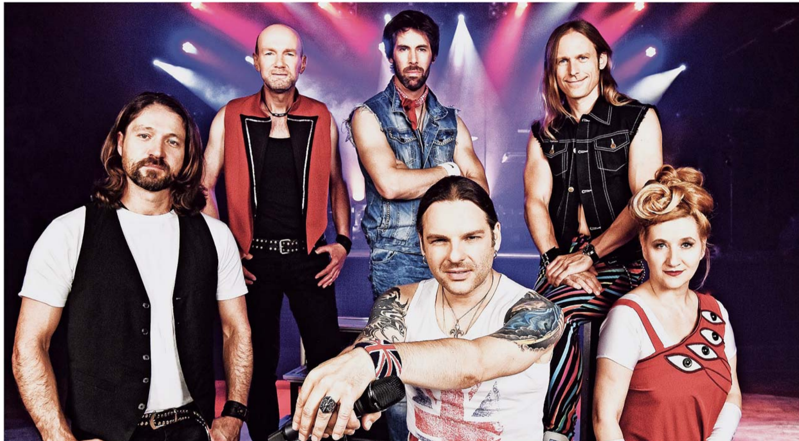
Die Queen Tribute-Band Queen Kings präsentiert zahlreiche Erfolgstitel und weltbekannte Songs der legendären Band.