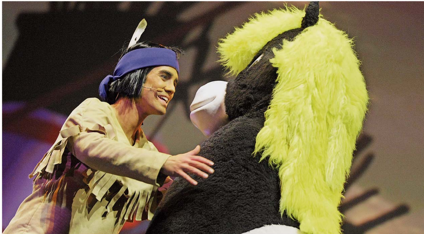
Yakari und sein bester Freund Kleiner Donner erleben auf der Suche nach dem „Geheimnis des Lebens“ viele Abenteuer.

KRÖV (red) Bei einem Galakonzert am Dienstag, 18. September, um 19.30 Uhr in der Weinbrunnenhalle in Kröv singen die beiden Musiker von Tenöre4you berühmte und legendäre Hits aus Pop, Klassik, Musical und Filmmusik. Toni Di Napoli und Pietro Pato präsentieren in ihrem Konzert eine Pop-Klassik-Mischung mit erstklassigem Live-Gesang in italienischem Gesangsstil. Karten: 21 Euro.