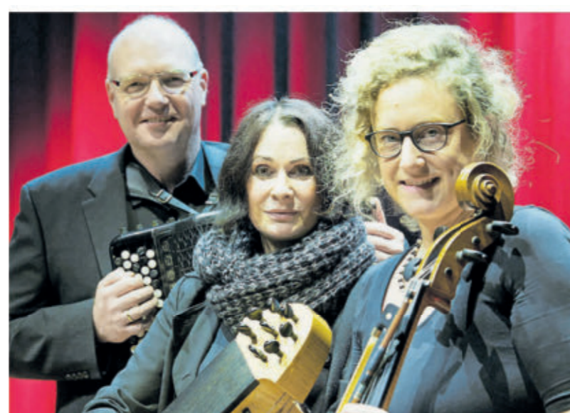
Das Parnass Ensemble tritt an zwei Tagen im Kasino am Kornmarkt auf.

TRI ER (red) Zarah Leander, Megastar und Schlagerlegende der UFA-Zeit, war die bestbezahlte Künstlerin der Filmgeschichte. Ihre Lieder wurden millionenfach verkauft. Die Film-Industrie verdiente an ihr Milliarden. Wie alle Künstler ihrer Zeit geriet sie in die Wirren des Zweiten Weltkrieges und kehrte 1942 nach Schweden zurück. Auch heute noch werden die Melodien von Generation zu Generation weitergetragen. Dieser Abend ist eine Hommage an die Sängerin Zarah Leander. Eine musikalische Revue mit dem Parnass-Trio – Die berühmtesten Hits eines Weltstars in einer unterhaltsamen Revue am Dienstag, 27. Dezember , und am Mittwoch, 28. Dezember , jeweils 20 Uhr, im Kasino am Kornmarkt in Trier. Karten gibt es für 22 Euro bei der TV-Tickethotline 0651/7199-996.