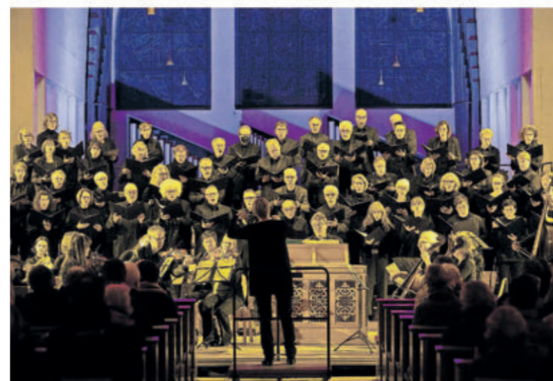
Der Friedrich-Spee-Chor Trier stimmt mit seinem Konzert auf Weihnachten ein.