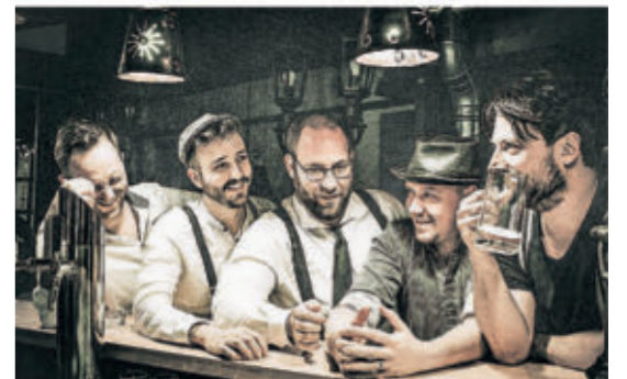
Die Band Tubadiesel spielt einen Mix aus Reggae, Polka und Ska.

einem fulminanten Livepaket zusammen. Der Eintritt zum Fest und zu allen Attraktionen ist frei.