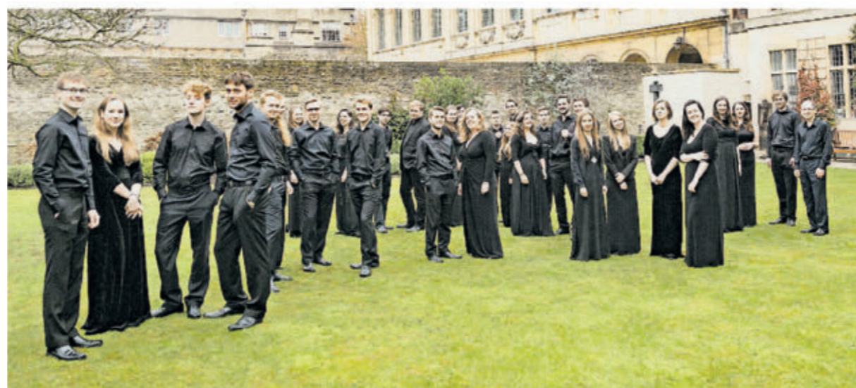
Der Chor des Queen's College Oxford auf Deutschlandtournee.

Der Chor macht auf seiner Deutschlandtournee Station in Trier und wird am Freitag, 1. September , um 19.30 Uhr ein Konzert in der Liebfrauenkirche in Trier geben. Mit Werken von Byrd bis Bruckner und Monteverdi bis MacMillan werden die 30 jungen Sängerinnen und Sänger unter der Leitung von Owen Rees den einzigartigen englischen Chorklang nach Trier bringen. Der Eintritt ist frei, um eine Spende wird gebeten.