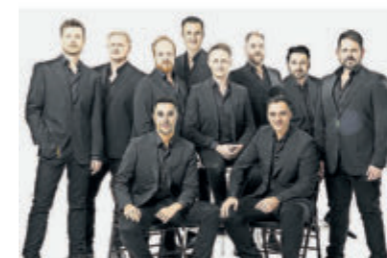
sich auf all ihre Klassiker freuen, darunter „Bohemian Rhapsody“, „Hallelujah“, „Nessus Dorma“ und neu ausgewählte Songs wie „(I've Had) The Time Of My Life“. Am Mittwoch, 22. Januar 2025 , 20 Uhr, sind die The Ten Tenors in der Europahalle Trier zu Gast. Karten ab 64,55 Euro.

TRIER (red) Nach ihren ausverkauften Tourneen durch Australien, Neuseeland, Südamerika und die USA werden die The Ten Tenors , Australiens Rockstars der Opernwelt, ihr 30-jähriges Jubiläum mit einer Rückkehr nach Deutschland im Jahr 2025 feiern. Die 30-jährige Jubiläumstournee präsentiert die beliebtesten und meistgehörten Lieder der The Ten Tenors aus ihrer 30-jährigen Geschichte. Die größten internationalen und virtuossten Akkordeonisten aus. Nach einer vierjährigen Pause, in der er sich von der Musik abgewandt hatte, entdeckte er die Welt des Jazz für sich. Gemeinsam mit seinen musikalischen Partnern, Lucas Niggli und Michel Godard, lässt er Grenzen von alter und neuer Musik verschwimmen und macht eine geografische Einordnung unmöglich. Am Freitag, 23. August , 20 Uhr, ist Luciano Biondini im Rahmen des Mosel Musikfestivals im IHK Tagungszentrum Trier zu Gast. Karten: 34 Euro.